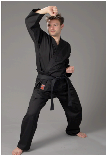
Abb. 1: Karatekämpfer in der Grundstellung

Die Bereitschaftsstellung wie sie verschiedene Sportarten kennen, repräsentiert anschaulich, was damit konkret gemeint ist: ein guter Stand, elastische Haltung, präzise Aufmerksamkeit.